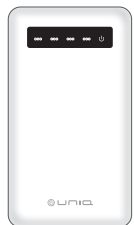
パワーカード POWER CARD 取扱説明書